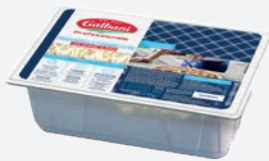
Galbani Julienne Fior Di Latte