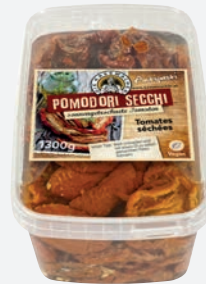
Die Käsemacher Tomaten getrocknet