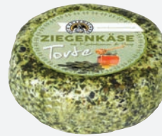
Die Käsemacher Ziegenkäsetorte Honig-Kürbis