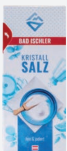
Bad Ischler Speisesalz 500g per Packung