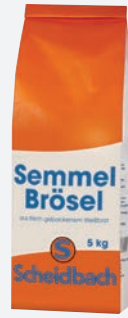
Scheidbach Semmelbrösel 5 kg per Sack