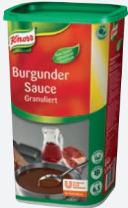
Knorr Burgundersauce 1,26 kg per Packung