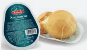
Sabelli Scamorza geräuchert