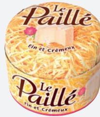
Le Paillé Weichkäse