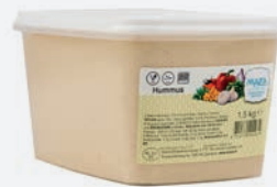
Maza Hummus Natur