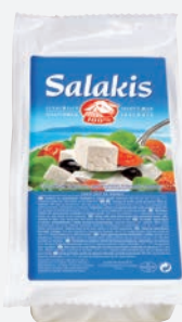
Salakis Schafkäse Block