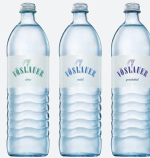
Vöslauer ohne, mild oder prickelnd MW 0,75l per Flasche