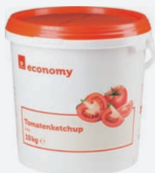
Economy Ketchup 10kg per Eimer