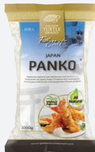
Golden Turtle Chef Panko Brotkrumen 1 kg per Sack