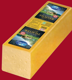
Tirol Milch Tiroler Alpentilsiter