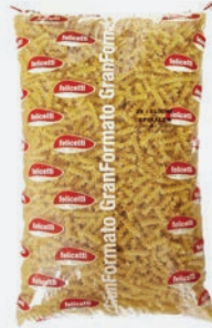
Felicetti Spiralen Nr. 28 5 kg per Sack