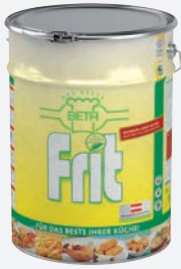
Beta Frit Frittierfett 20l DS halbfüssig per Kanister